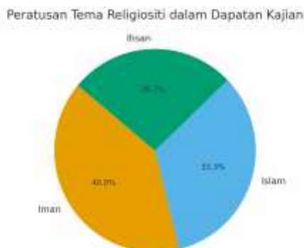
Rajah 2: Peratusan Tema Religiositi dalam Dapatan Kajian

Kajian terdahulu menunjukkan bahawa integriti dan religiositi mempunyai hubungan rapat dalam membentuk identiti profesional Muslim. Menurut Mokhtar et al. (2021), konsep integriti Islam menekankan nilai amanah, tanggungjawab dan ketelusan sebagai asas tadbir urus. Krauss et al. (2005) membangunkan instrumen pengukuran religiositi Muslim (MRPI) yang menjelaskan peranan iman dan amalan ibadah dalam personaliti Muslim. Manap et al. (2013) pula menekankan keperluan model pengukuran religiositi yang lebih komprehensif bagi menilai hubungan antara agama dan akhlak. Dalam konteks Malaysia, isu integriti sering dikaitkan dengan cabaran rasuah dan salah guna kuasa. Laporan Transparency International (2023) menunjukkan Malaysia berada di kedudukan ke-61 daripada 180 negara dalam Indeks Persepsi Rasuah (CPI), menandakan masih banyak ruang untuk memperkukuh integriti dalam sektor awam dan swasta. Oleh itu, sorotan literatur ini mengesahkan keperluan mengintegrasikan elemen Iman, Islam, dan Ihsan dalam membangunkan model integriti profesional Muslim.